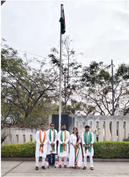
13. Dated 26 Jan 2026, celebration of Republic day