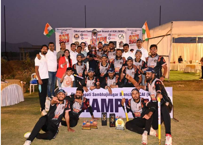
10. Dated 22-26 Jan 2026, Winner team MI Renegades