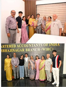
ALTERED ACCOUNTANTS OF INDIA IBHAJINAGAR BRANCH (WIRC)